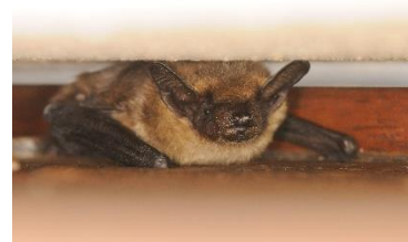
Sérotine commune, Ludovic Jouve

Les chauves-souris apprécient se suspendre aux charpentes, dans les greniers, dans les caves, elles se réfugient derrière les volets et trouvent aussi refuge sous les toits. On peut les trouver en toute saison dans les mazets, les bergeries, les églises, les immeubles, mais aussi dans les ouvrages d'arts et les cavités arboricoles, elles sont très sensibles au dérangement et à la lumière des lampes torches.